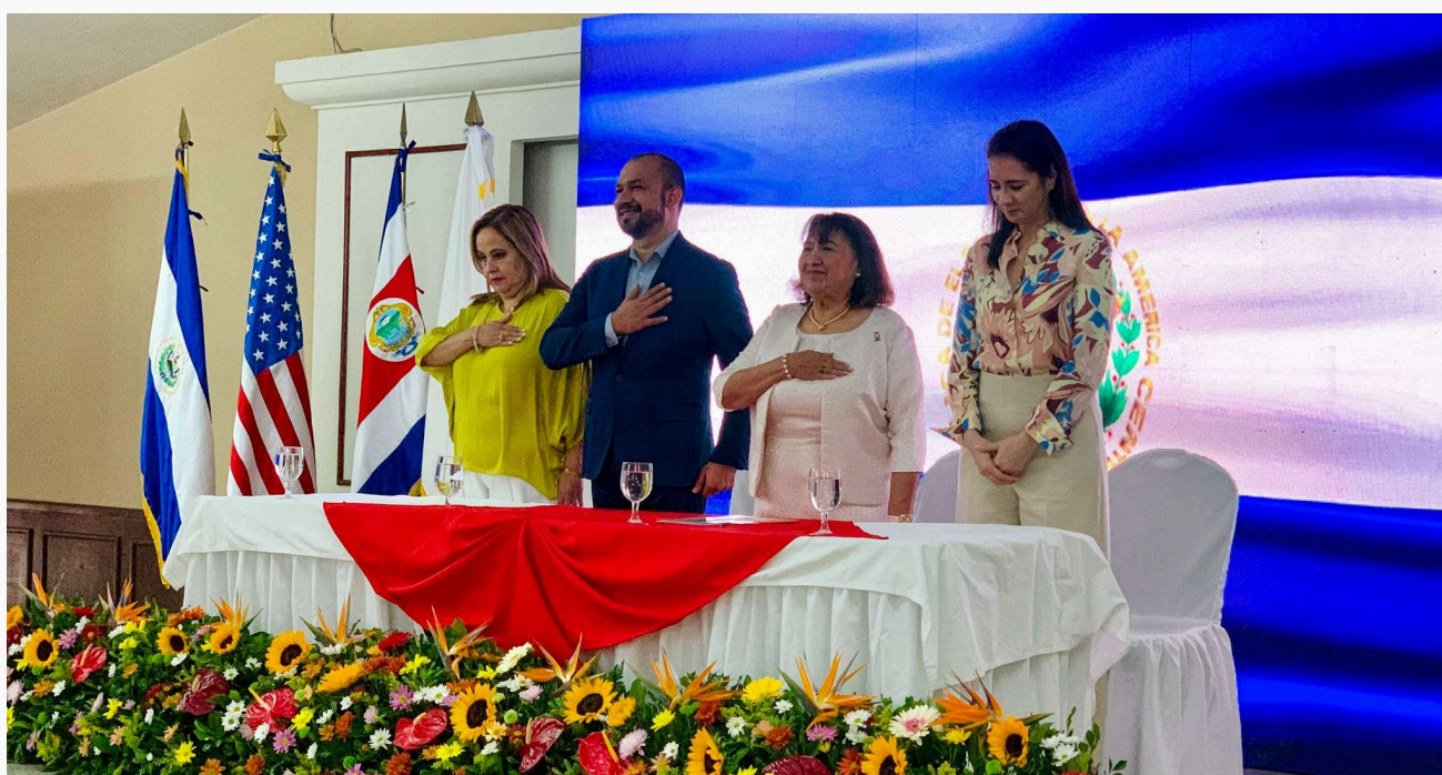
Momentos destacados del Primer Congreso Internacional 'Educación e Innovación' de la Universidad Modular Abierta, con expertos internacionales y autoridades académicas.