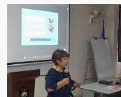
Emprendimiento de las juventudes en medios digitales, organizado por la Universidad Modular Abierta el 3 de marzo de 2023, exploró oportunidades digitales para jóvenes emprendedores.

Para más detalles, puede acceder al enlace de la grabación del evento: Webinar Internacional "Emprendimiento de las juventudes en medios digitales" .