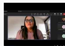
Expertos en el Webinar Internacional "Emprendimiento de las juventudes en medios digitales", 30 de agosto de 2023.

Para más detalles, puede acceder al enlace de la grabación del evento: Webinar Internacional "Emprendimiento de las juventudes en medios digitales" .