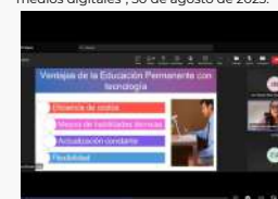
Participantes del Webinar Internacional "Emprendimiento de las juventudes en medios digitales", 30 de agosto de 2023.