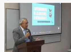
Momentos destacados del Webinar Internacional "Emprendimiento de las juventudes en medios digitales", celebrado el 3 de marzo de 2023, presentando ideas y estrategias para el emprendimiento juvenil en el ámbito digital.