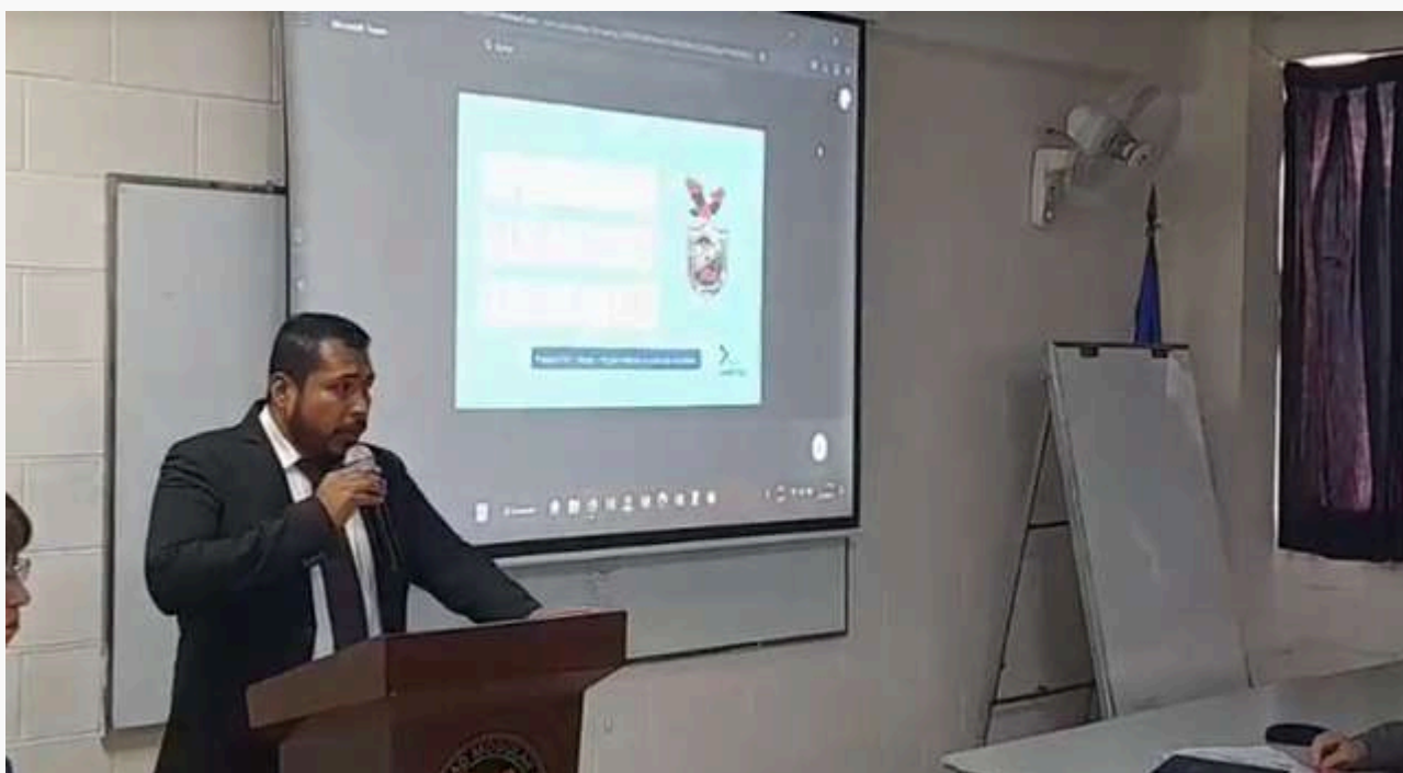
Los participantes del Webinar Internacional "Emprendimiento de las juventudes en medios digitales", realizado el 3 de marzo de 2023 por la Universidad Modular Abierta, exploraron estrategias y herramientas digitales para el desarrollo de proyectos emprendedores.