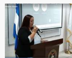
Una de las ponentes del Webinar Internacional en conmemoración del Día de la Mujer, celebrado el 13 de marzo de 2023, compartiendo sus valiosas experiencias.