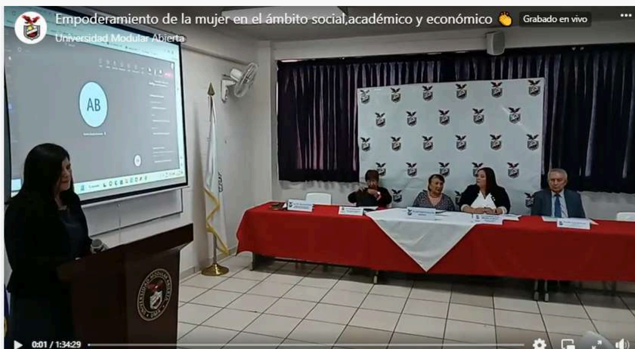
Imagen oficial del Webinar Internacional en conmemoración del Día de la Mujer, organizado por la Universidad Modular Abierta el 13 de marzo de 2023. El evento destacó la participación de mujeres influyentes y celebró sus contribuciones y logros.