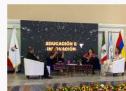
Conectando saberes en el Congreso Internacional de la UMA.