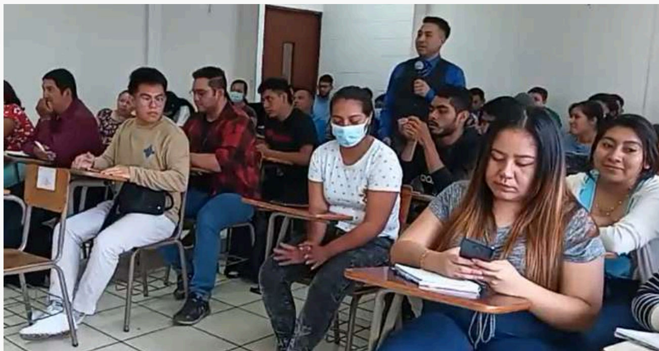
Destacados expertos y académicos reunidos en el Primer Congreso Internacional 'Educación e Innovación' de la Universidad Modular Abierta.