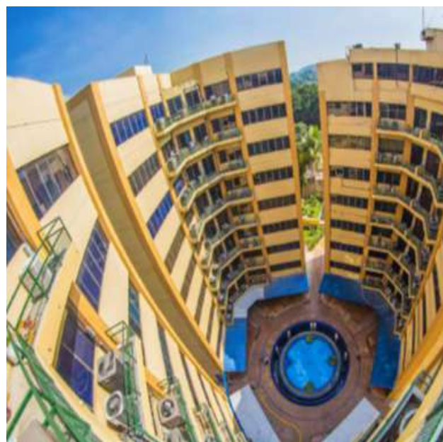
Edificio del Ministerio de Hacienda - Tres Torres

entidades públicas para iniciar el proceso de implementación de las NICSP, para ello, el 17 de agosto de 2016 a través de un Acuerdo Ejecutivo, se estableció que se realizará la adopción e implementación de las Normas Internacionales de Contabilidad del Sector Público (NICSP) en las entidades que conforman este sector.