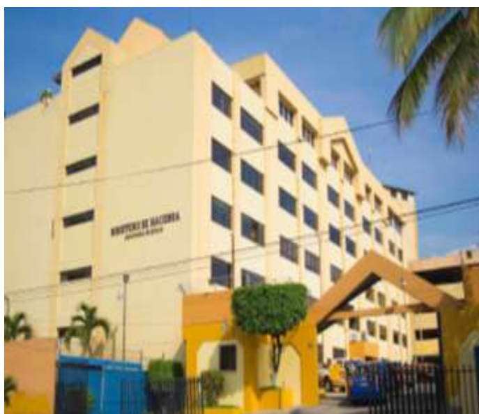
Edificio del Ministerio de Hacienda

El nuevo enfoque contable, responde a exigencias del Plan de Gobierno y es una iniciativa que viene pretendiendo desarrollarse desde el año 2001, período en el cual la Dirección General de Contabilidad Gubernamental, realizó esfuerzos para dar inicio al proceso de implementación de estándares internacionales; sin embargo, es hasta el año 2012, que aunque no se tenía claridad respecto a la forma más adecuada de incorporar la normativa internacional a nuestro país, se tomó la decisión de aplicar estándares internacionales que facilitaran el registro, medición y revelación de la información financiera del Sector Público, por lo que se decidió adoptar las NICSP.